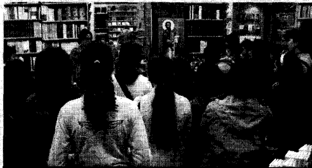
Gli studenti della prima media delle Canossiane